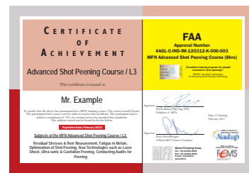
Fortgeschrittene / L3 Zertifikat mit FAA Ref. Nr.

Anmeldung an Fax Nr. +41.44.831 2645 oder E-Mail an: info@mfni.li Bei Fragen Tel. +41.44.831 2644