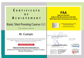
Grundlagen / L1 Zertifikat mit FAA Ref. Nr.