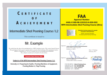
Erweiterte Grundlagen / L2 Zertifikat mit FAA Ref. Nr.