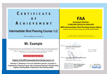
Erweiterte Grundlagen / L2 Zertifikat mit FAA Ref. Nr.