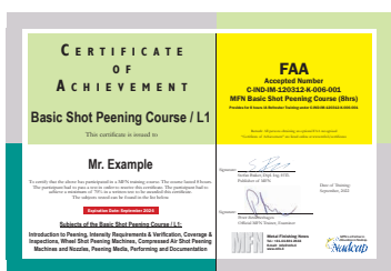
Grundlagen / L1 Zertifikat mit FAA Ref. Nr.